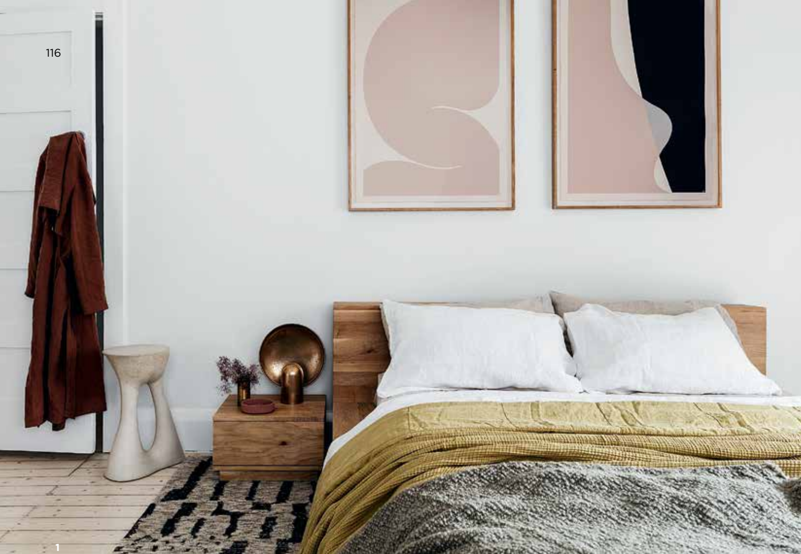
1. Спальня. На стене две работы Кэролайн Уоллс из серии Maybe She. Столик из камня Criteria Collection. Ковер Robyn Cosgrove. 2. Гостиная. Винтажное кресло F-444, Пьер Полен, Artifort. Кофейный столик Ixo Кристофа Делькура. Диван MCM House. Бра, Джо Коломбо, Oluce. 3. Фрагмент гостиной. На столе — бусы из переработанного стекла, изготовленные в Гане.